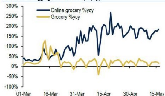
Chart 11: Daily online spending at groceries vs. all spending at groceries, based on BAC aggregated card data (% yoy)

Se Amazon è uno dei grandi vincitori di questo universo, anche attori tradizionali come Walmart (WMT) hanno registrato un aumento dei ricavi relativi alla spesa online, passati dal 9,2% in totale vs 5,9% l'anno scorso.