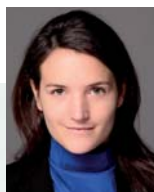
M. Carmignac Gestore del Fondo

Per una performance decorrelata dai mercati internazionali e un obiettivo di bassa volatilità