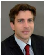
X. Hovasse Analista, Latin America