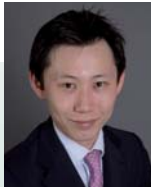
D. Young Park Analista, Asia