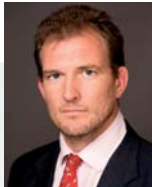
S. Pickard Gestore del fondo

L'esperienza di Carmignac per cogliere le migliori opportunità del mondo emergente